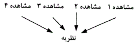
شکل الف شیوه ی .....

۴۸- «شکل الف» و «شکل ب» به ترتیب در کدام گزینه زیر نام گذاری شده است؟